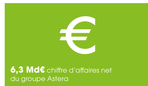
Chiffre d'affaires du Groupe par activité en 2024